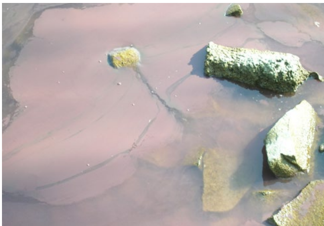
Abb. 3: Das „Burgunderblut-Phänomen“: An der Wasseroberfläche bildet die Burgunderblutalge einen rötlichen Film.

Bei einer vollständigen Durchmischung des Sees werden die Gasvesikel durch den zunehmenden hydrostatischen Druck der Wassersäule zerstört (Abb. 2 [1a-2a]). Die stärksten heute bekannten Gasvesikel [1], widerstehen dem Wasserdruck bis in eine Tiefe von ungefähr 100 Metern (maximale Tiefe Bodensee-Obersee: 251 Meter). Die Zellfäden gelangen dann aus der Tiefe nicht mehr in