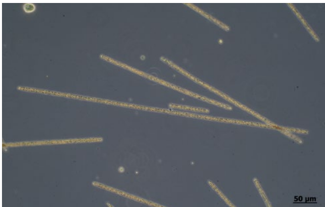
Abb. 1: Unter dem Mikroskop sind die bis zu millimeterlangen, unverzweigten Zellfäden der Burgunderblutalge sehr gut erkennbar.