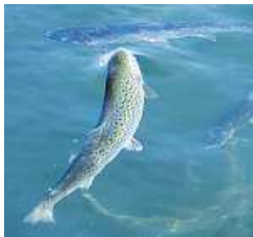
Ein ausgewachsener Bio-Zuchtlachs wiegt drei bis vier Kilogramm.

So darf die Bestandsdichte im Gehege nicht mehr als zehn bis zwölf Kilogramm pro Kubikmeter betragen. In herkömmlichen Zuchtbetrieben werden dagegen bis zu 40 Kilogramm pro Kubikmeter erreicht. Und auf dem Speiseplan der Lachse stehen ausschliesslich biologische respektive natürliche Zutaten.