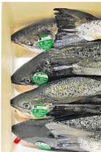
Erkennungsmarke: Der irische Zuchtlachs trägt das Qualitätslabel von Bio Suisse.

Von daher ist es denn auch kein Wunder, dass der Bio-Lachs sowohl das Qualitätszertifikat ISO 9002 erhalten hat als auch eines der am schwersten zu erhaltenden Gütezeichen mit strengsten Auflagen: das Label Bio Suisse. Und so lässt sich das köstliche feste Bio-Lachsfleisch auch mit gutem Gewissen geniessen! ■